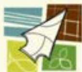
POINTE-DU-BUISSON MUSÉE QUÉBÉCOIS D'ARCHÉOLOGIE