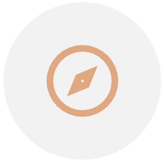
Visites commentées/ Rallyes