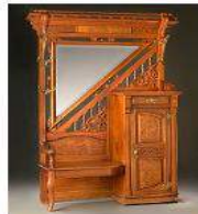
© Musée des beaux-arts de Montréal